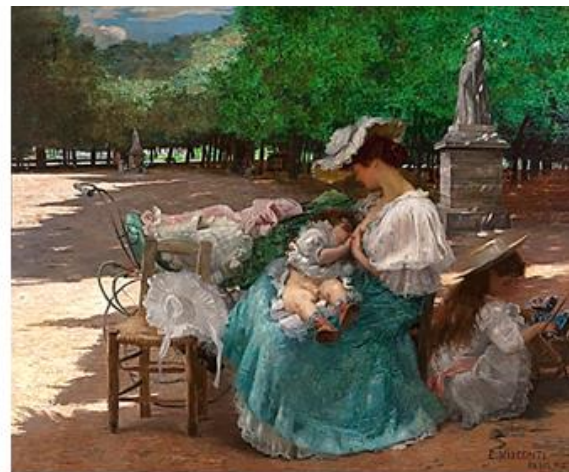
“Maternidade” de Eliseu Visconti.

O autorretrato é uma representação do próprio artista, que mostra a si mesmo na obra realizada; ou seja, é a pintura dele mesmo. Observe alguns exemplos: