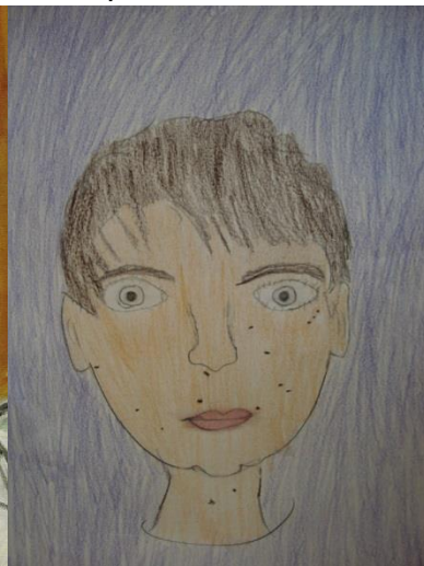
Autorretrato aluno 6º ANO