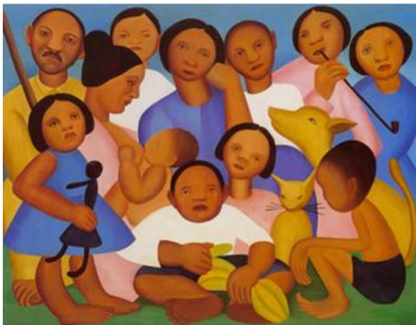
“A família”. Tarsila do Amaral

Chamamos de retrato imagens que representam uma ou mais pessoas por intermédio de fotografia, pintura, desenho, escultura ou gravura. Veja alguns exemplos: